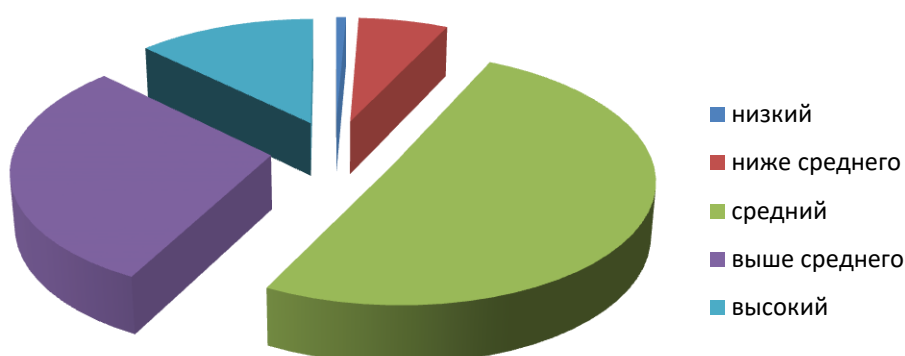
Рис. 2 Результаты анкетирования по уровню воспитанности

Низкий уровень воспитанности наблюдается у 2 воспитанников – 0,7 %. Низкий уровень воспитанности представляется слабым, еще неустойчивым опытом положительного поведения, которое регулируется в основном требованиями старших и другими внешними побудителями, при этом саморегуляция и самоорганизация ситуативны. Характеризуется отрицательным опытом поведения воспитанника, которое с трудом исправляется под влиянием педагогических воздействий, неразвитостью самоорганизации и саморегуляции.