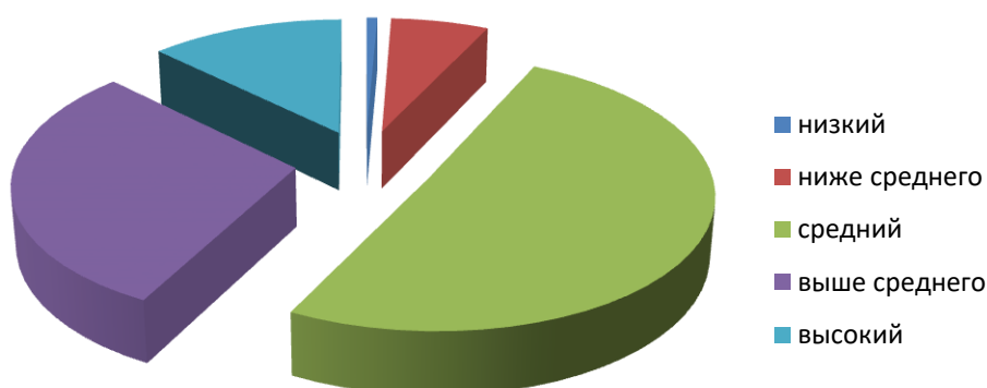
Рис. 2 Результаты анкетирования по уровню воспитанности

Низкий уровень воспитанности наблюдается у 2 воспитанников – 0,7 %. Низкий уровень воспитанности представляется слабым, еще неустойчивым опытом положительного поведения, которое регулируется в основном требованиями старших и другими внешними побудителями, при этом саморегуляция и самоорганизация ситуативны. Характеризуется отрицательным опытом поведения воспитанника, которое с трудом исправляется под влиянием педагогических воздействий, неразвитостью самоорганизации и саморегуляции.