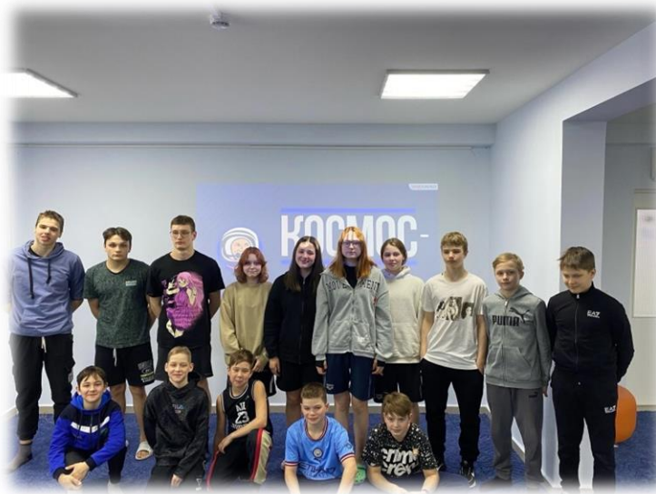
Игровая программа «Космос»