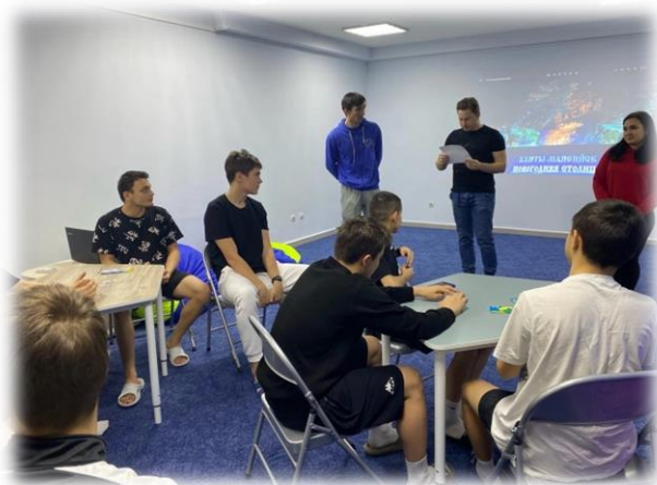
Игровая программа «Югра-край родной»