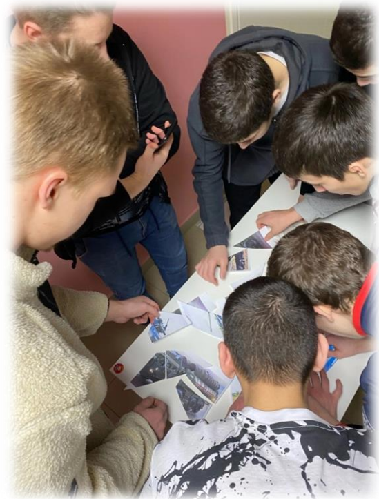
Квест-посвящение «ЮКИОР одна семья»