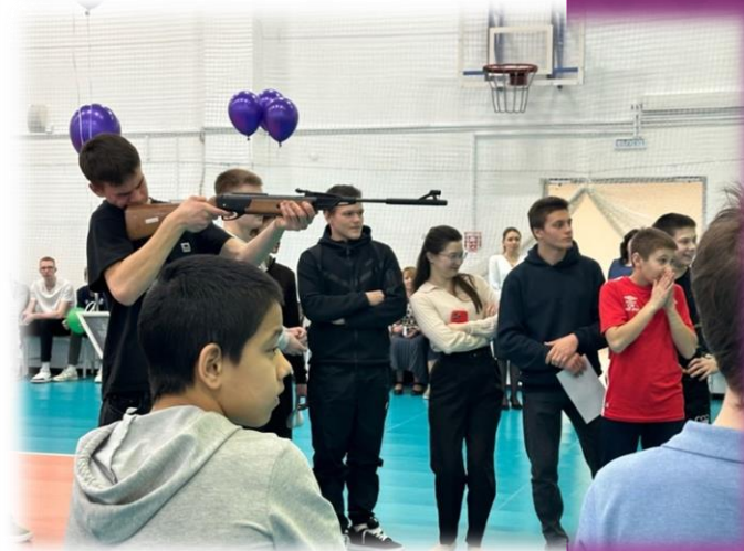
игровая программа «Форт-бойрд»