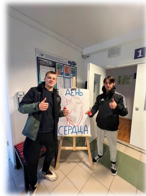
Акция «День сердца»