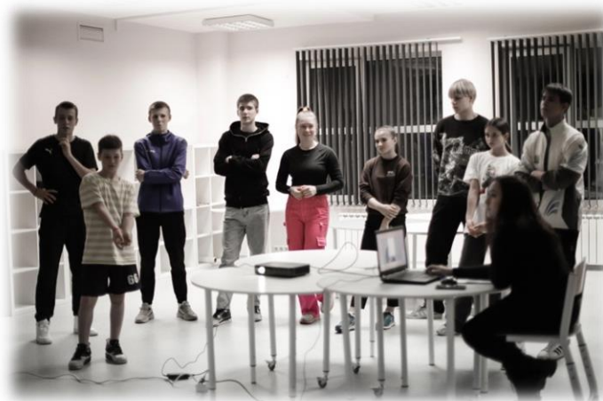
Квест- посвящение «ЮКИОР одна семья»