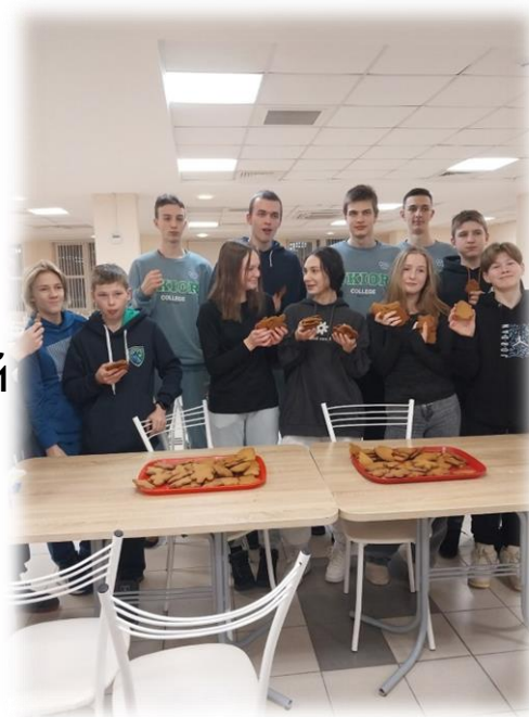
Мастер-класс «Рождественский пряник»